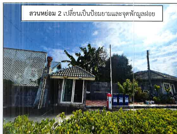
สวนหย่อม 2 เปลี่ยนเป็นป้อมยามและจุดพักมูลฝอย