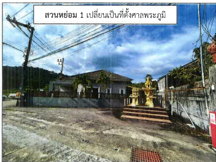
สวนหย่อม 1 เปลี่ยนเป็นที่ตั้งศาลพระภูมิ